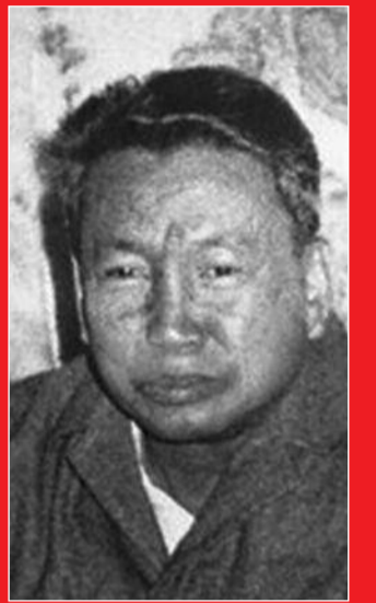
Pol Pot Massenmörder

des römischen Kaisers Nero oder von Kommunisten eines Schlages wie Pol Pot, Mao Tse-tung oder Stalin.