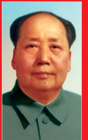
Mao Tse-tung Massenmörder